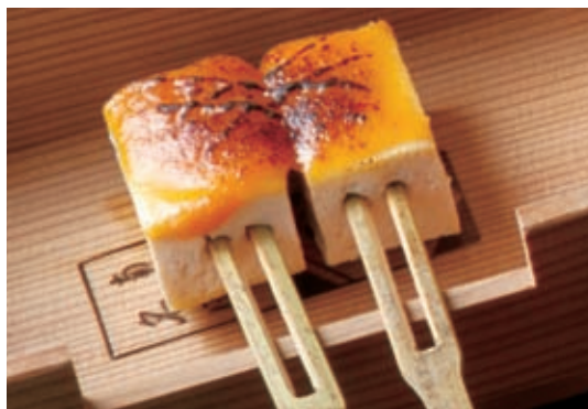
田乐是在串成串的豆腐或魔芋等食材上抹上味增后烤制而成的一道料理。