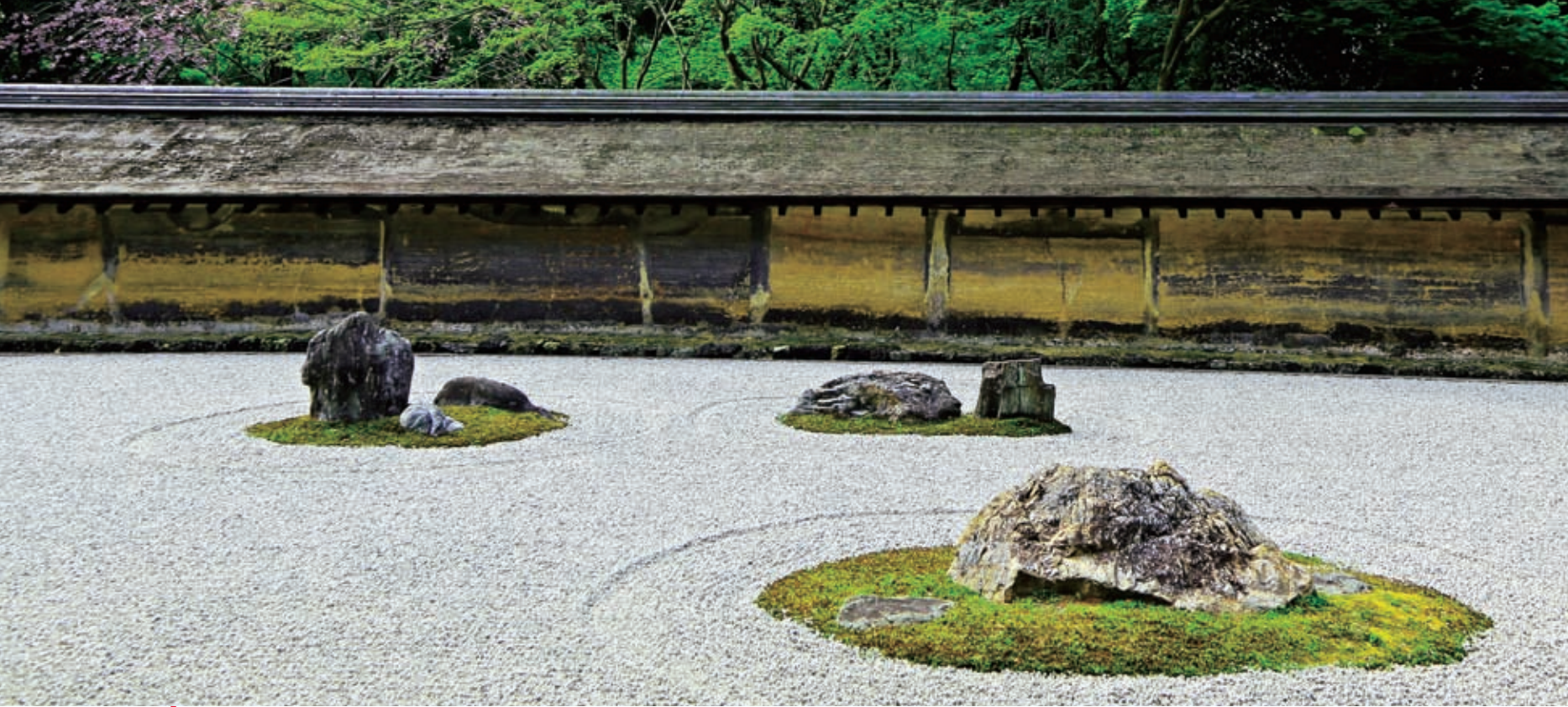
上 / 龙安寺 (京都府) 较具代表性的枯山水庭园。