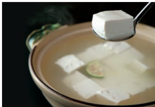
当豆腐在锅中开始晃动时，便是汤豆腐的最佳品尝时机。

汤豆腐怀石，便是将茶席中提供的菜肴也就是怀石，与汤豆腐结合在一起的料理。怀石料理，是用来款待客人，为更好地品茶而提供的日式套餐，而在汤豆腐怀石中，则以汤豆腐为主角，还能品尝到涂抹味增的“豆腐田乐”等各种豆腐料理。在享受色彩斑斓的时令食材的同时，欣赏眼前多姿多彩的美丽庭园。这段静谧的时光，必能足以填满您的内心。