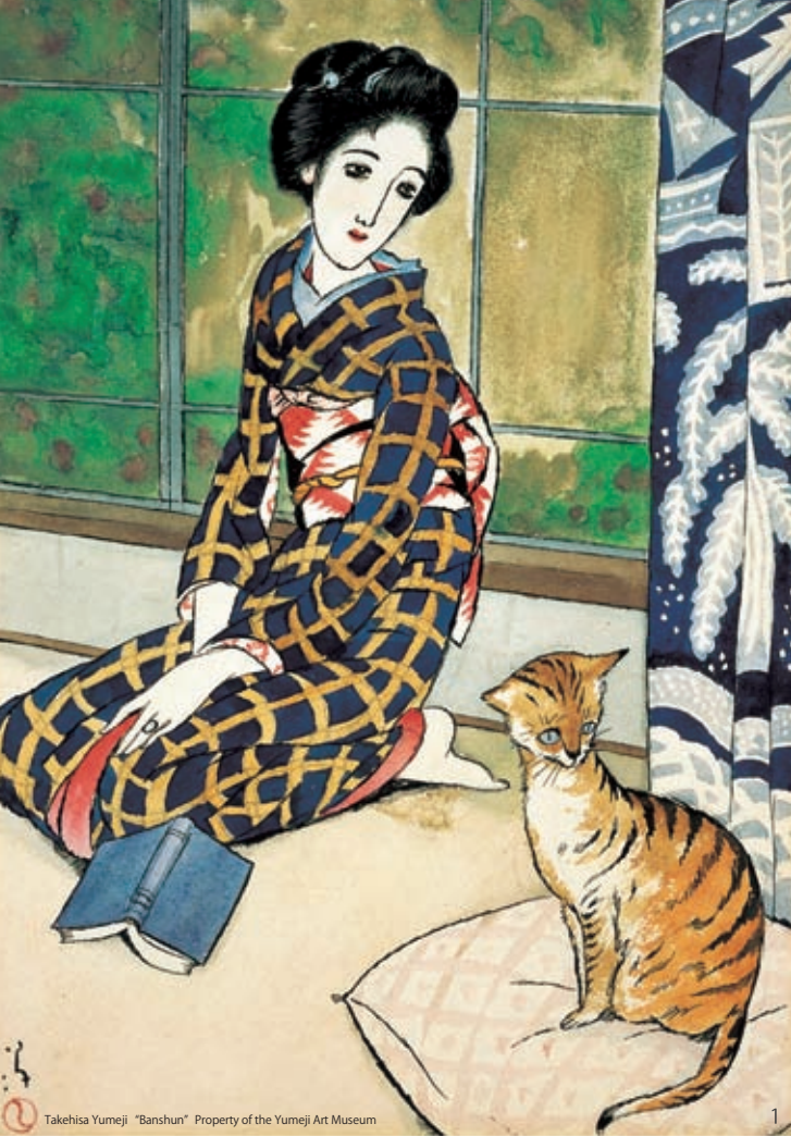
Takehisa Yumeji "Banshun" Property of the Yumeji Art Museum