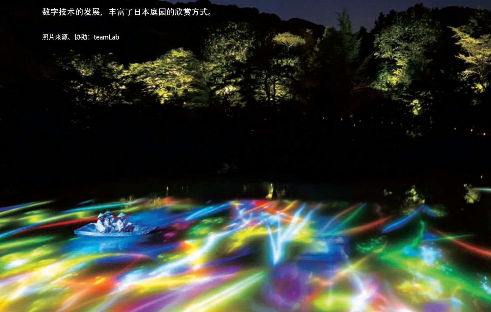
《与小舟共舞的鲤鱼勾勒出的水面样貌——御船山乐园池塘》。 投映在池中的鲤鱼与在水面上摇曳前进的小舟共同变幻，为池塘增添了新的面貌。