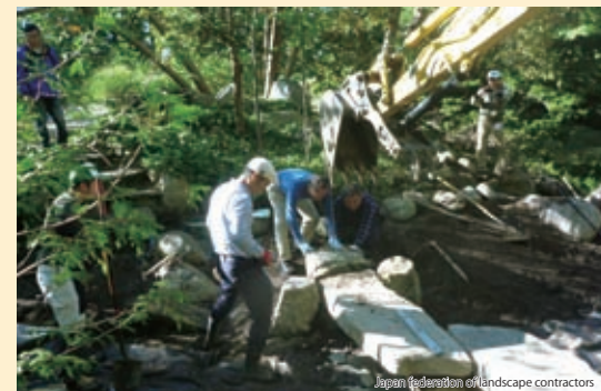
2018 年在美国密歇根州克兰布鲁克的日本庭园内开展的活动

据说，如今在海外的日本庭园数量也已超过了500处。然而其中也存在难以维护和管理，需要进行修复改造的庭园，对此，日本政府以此类庭园为对象，于2017年出台重建项目。从日本派遣庭园技术专家，从事修复工作，向现地技术人员提供简单易懂的维护管理手册等帮助。