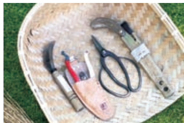
从左下起依次为锄草刀、修枝剪、盆景剪、修枝锯。庭师会自行购买适合自己的工具。