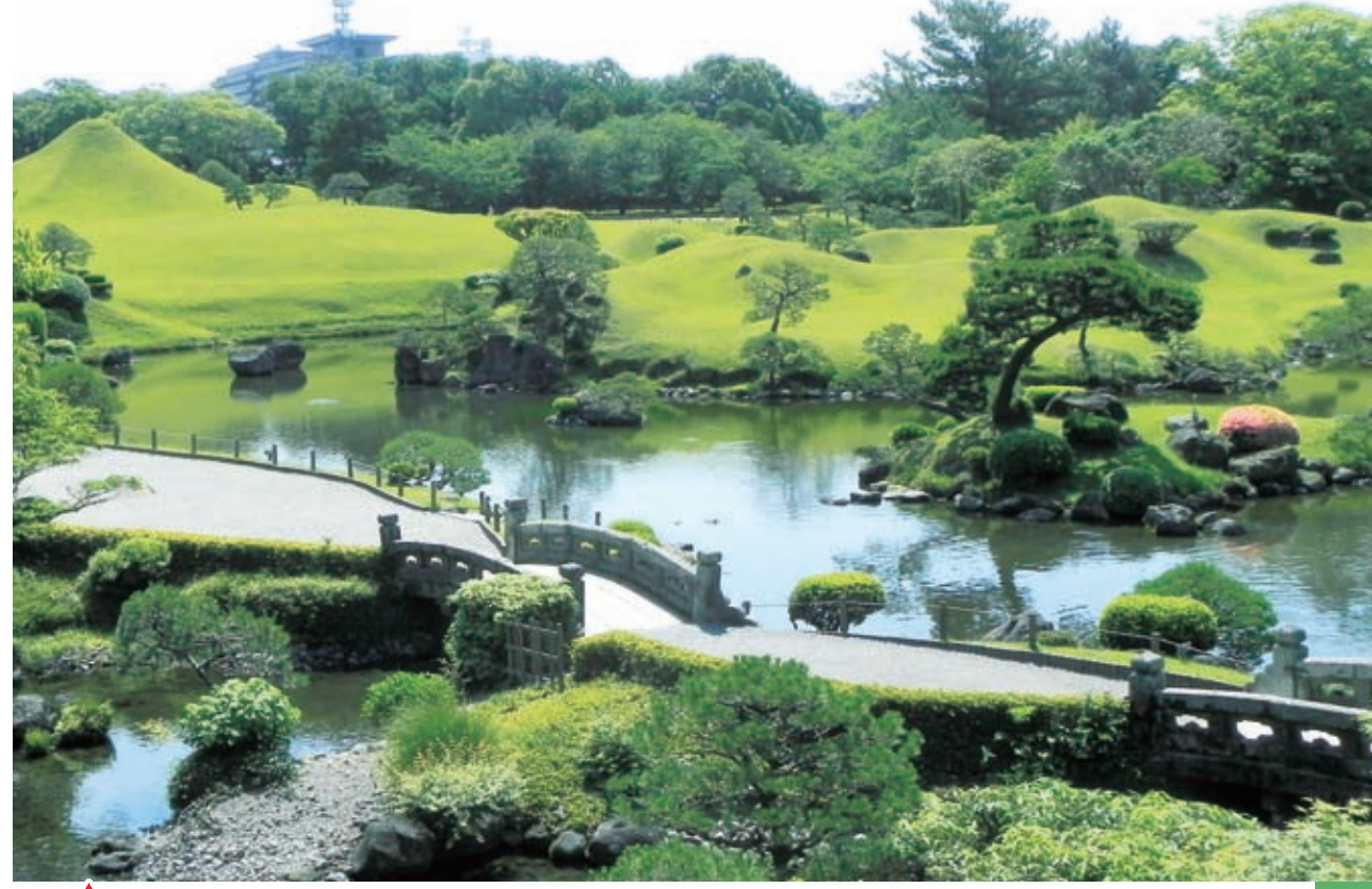
上 / 水前寺成趣园 (熊本县) 回游式庭园。