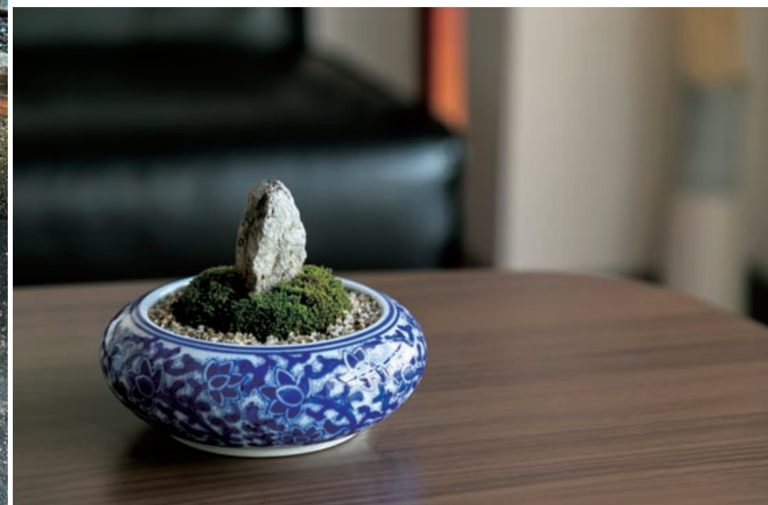
除了室内以外，还可以摆放在家门口，供来宾欣赏。