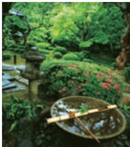
封面 / 圆光寺（京都府）

本刊的刊名“にぽにか(niponica)”源于“日本”的日语发音“Nippon”。“にぽにか(niponica)”是向世界广泛介绍现代日本社会、文化的杂志，除了日文版以外，还有英文版、西班牙文版、法文版、中文版、俄文版、阿拉伯文版，共以7种语言出版发行。