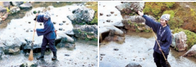
上 / 半田小姐观察庭园内花草，根据情况进行修剪。 下 / 工作时应对游客的提问也是庭师的任务之一。庭师还肩负着营造庭园风趣的工作。