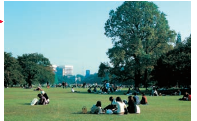
上 / 设有开阔草坪的新宿御苑 (东京都)