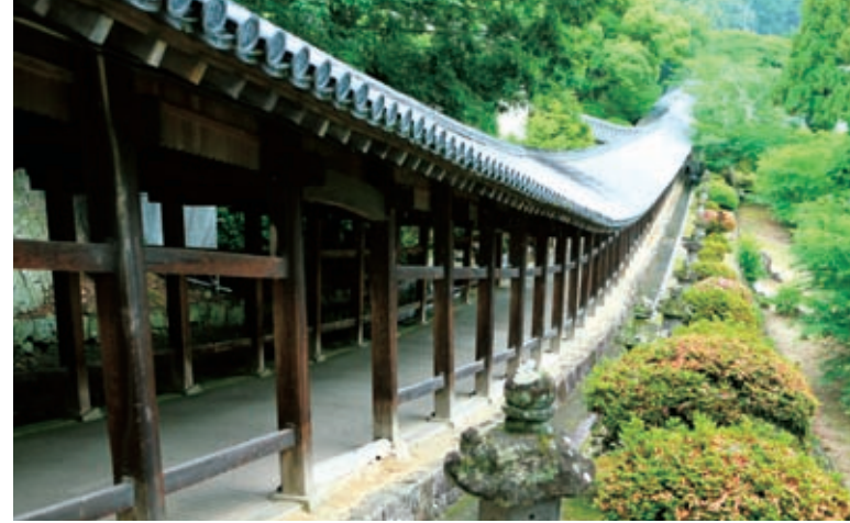
上 / 吉备津神社的回廊。可以在漫步的同时眺望随季节而变的景色。 右 / 备中松山城看上去像是浮在天空之中，因此有着“天空山城”等别称。

如果还有足够的时间，还可以去逛一逛横贯吉备高原的吉备街道。在这里分布着各种与桃太郎传说有关的