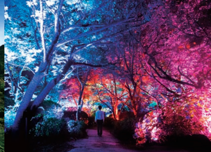
左 / 御船山乐园因有着树龄超过 3000 年、名列日本巨树排行第七的神木而闻名。 上 / 在与数字技术的融合下，到访者犹如误入神秘森林。