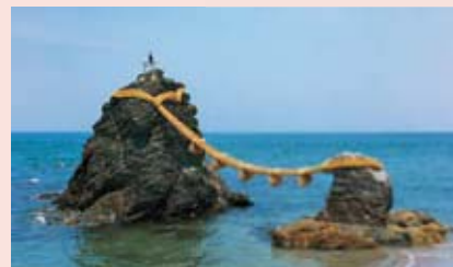
Estas rocas en el mar se consideran sagradas.

evitar sentimientos negativos. Algunas otras festividades estivales se celebraban para dar la bienvenida a los espíritus de los antepasados que venían a visitar este mundo. Si se recogía una buena cosecha en otoño, había que dar gracias a los dioses por sus bendiciones. Los fríos días de invierno eran el momento para expresar gratitud por un año que había estado libre de infortunios, así como esperanza por el nuevo año. De esta manera, las estaciones del año y sus variaciones se celebraban como forma de pedir ayuda a los dioses para superar los cambios y las adversidades. Como resultado de esto, existe una gran variedad de festejos durante todo el año, que perduran hoy día.