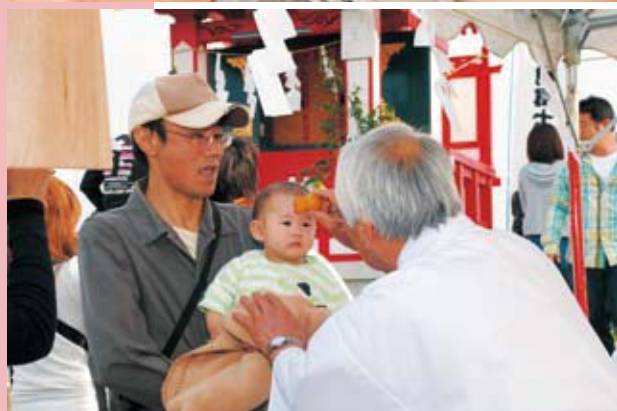
Arriba: El sello rojo impreso en el santuario sobre la frente es un símbolo de protección divina. Abajo: El sacerdote de este santuario sintoísta muestra afecto mientras aplica el sello rojo.