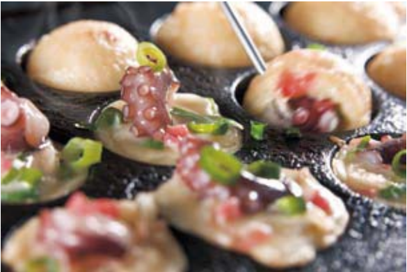
Se colocan los trozos de pulpo con el rebozado de harina de trigo en un molde semicircular para freírlo.