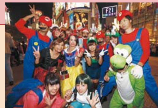
Jóvenes vestidos como personajes de anime y videojuegos.

Puntos de venta especiales en los grandes almacenes muestran disfraces, junto con accesorios de maquillaje. La creciente importancia económica de esta moda aumenta de año en año.