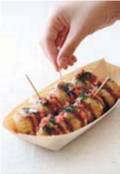
Se venden en bandejas con forma de barca en puestos callejeros en las fiestas y otros acontecimientos.

Vierta una masa de harina para rebozar en un molde semiesférico caliente, añada el pulpo cortado en dados, dele la vuelta a la mezcla para cocinarla en pequeñas bolas redondas, y ya tiene el tako-yaki . Dórelos con un diámetros de unos 3 cm (perfecto para meterlo en la boca), un tamaño pensado para comerlo sobre la marcha, ideal para ocasiones festivas.