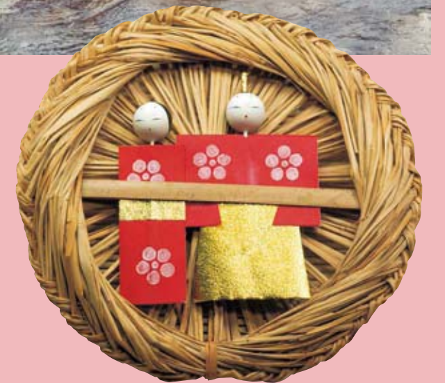
Parte superior de la página: Niñas vestidas con su mejor kimono ponen a flotar los muñecos como expresión de sus deseos. Abajo: Los muñecos de un matrimonio pueden usarse como sustitutos de las personas en un ritual.

Desde los comienzos de esta tradición, hace unos 400 años, los muñecos, hechos normalmente de papel, se frota sobre el cuerpo de una persona de forma que las desgracias e infortunios sean transferidos a los muñecos, y luego al río una vez los muñecos se pongan a la deriva en sus aguas. Actualmente, las niñas, con sus mejores vestidos de fiesta, se reúnen en la orilla el día de la fiesta y, junto con sus hermanas y otros miembros de sus familias, depositan los muñecos sobre la corriente de agua. La escena es bastante colorida, como corresponde a una fiesta para niñas.