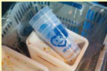
Marcas escritas con la palabra "Reuse" ("reutilizar") han ayudado a reducir la cantidad de basura.

Colaboración: Asociación del Plan de Acción Cero Basuras de la Fiesta de Gion