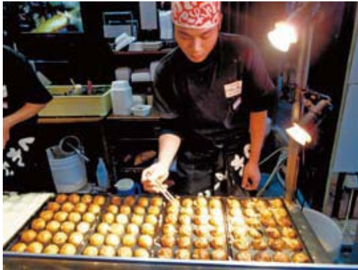
Un vendedor de tako-yaki en una festividad. Se utilizan varillas de metal para voltear los tako-yaki varias veces y darles una forma redondeada.