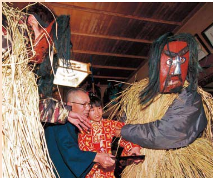
Mientras el namahage ahuyenta la pereza de los niños, los miembros de la familia hacen como que protegen a sus niños del namahage .

Sin embargo, lo único importante para la gente en donde se sigue esta costumbre es que los namahage son en realidad buenos espíritus que llegan para prevenir tanto a niños como a adultos contra la pereza, y a otorgar bendiciones para una buena salud, recoger una buena cosecha en los campos y un abundante suministro de alimentos del mar y de las colinas, y asegurar la buena suerte y la felicidad para el nuevo año. Los hogares que visitan los namahage están abiertos a darles la bienvenida amablemente con comida y sake hechos según recetas transmitidas de generación en generación.