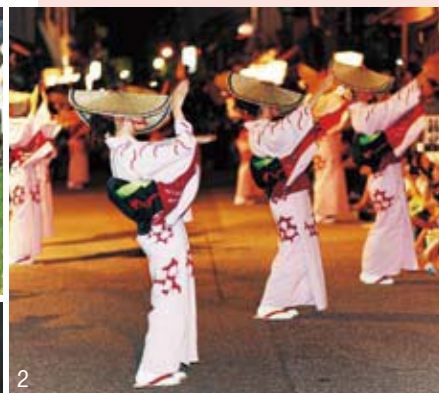
1 Fiesta de la plantación de arroz, que expresa ruegos para obtener una abundante cosecha. 2 Se dice que las danzas bon se celebran en el verano con el fin de ahuyentar a los espíritus que causan enfermedades. 3 Verduras y otros frutos de la cosecha son ofrecidos en otoño a los dioses. 4 Espíritus divinos que se considera que vienen en forma de ogros para traer bendiciones durante el invierno.