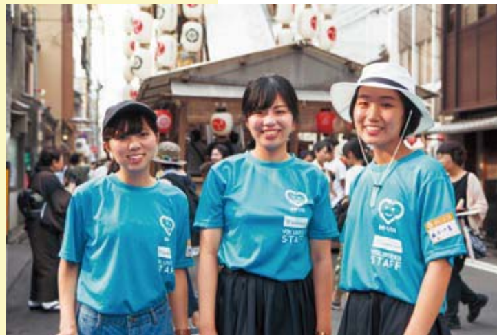
Camisetas uniformadas para unos 2.200 voluntarios, muchos de ellos estudiantes universitarios.

La Fiesta de Gion en Kioto tiene 1.100 años de antigüedad. Fantásticas carrozas salen a la calle, y unas 600.000 personas procedentes de todas partes de Japón se congregan para contemplarlas. Pero el acontecimiento genera casi 50 toneladas de basuras, y parte de estos residuos se quedan en las calles.