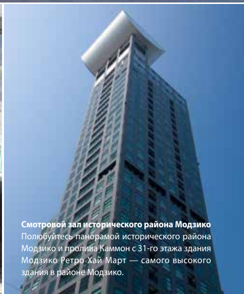
Смотровой зал исторического района Модзико Полуобъёмная панорама исторического района Модзико и пролива Каммон с 31-го этажа здания Модзико Ретро-Хай Март — самого высокого здания в районе Модзико.