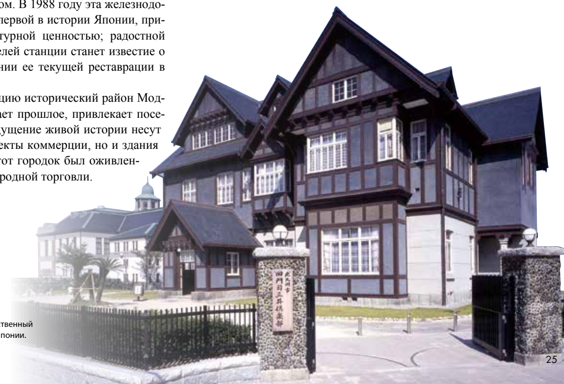
Клуб Мицци старого Модзи Построенный торговой компанией, этот общественный клуб является важной культурной ценностью Японии.

Зарубежные и отечественные гости с восхищением обнаружат, что здания бывших транспортных и торговых компаний, банков и складов могут отлично использоваться для музеев, галерей и ресторанов, которые занимают их сегодня. Осознание этого делает прогулки по этому приветливому портовому городку еще приятней. Кроме того, можно проехать на рикше и впитать ностальгическую атмосферу этого района или проплыть мимо величественных достопримечательностей на экскурсионном катере в сопровождении гида, слушая в обоих случаях рассказы о городке.