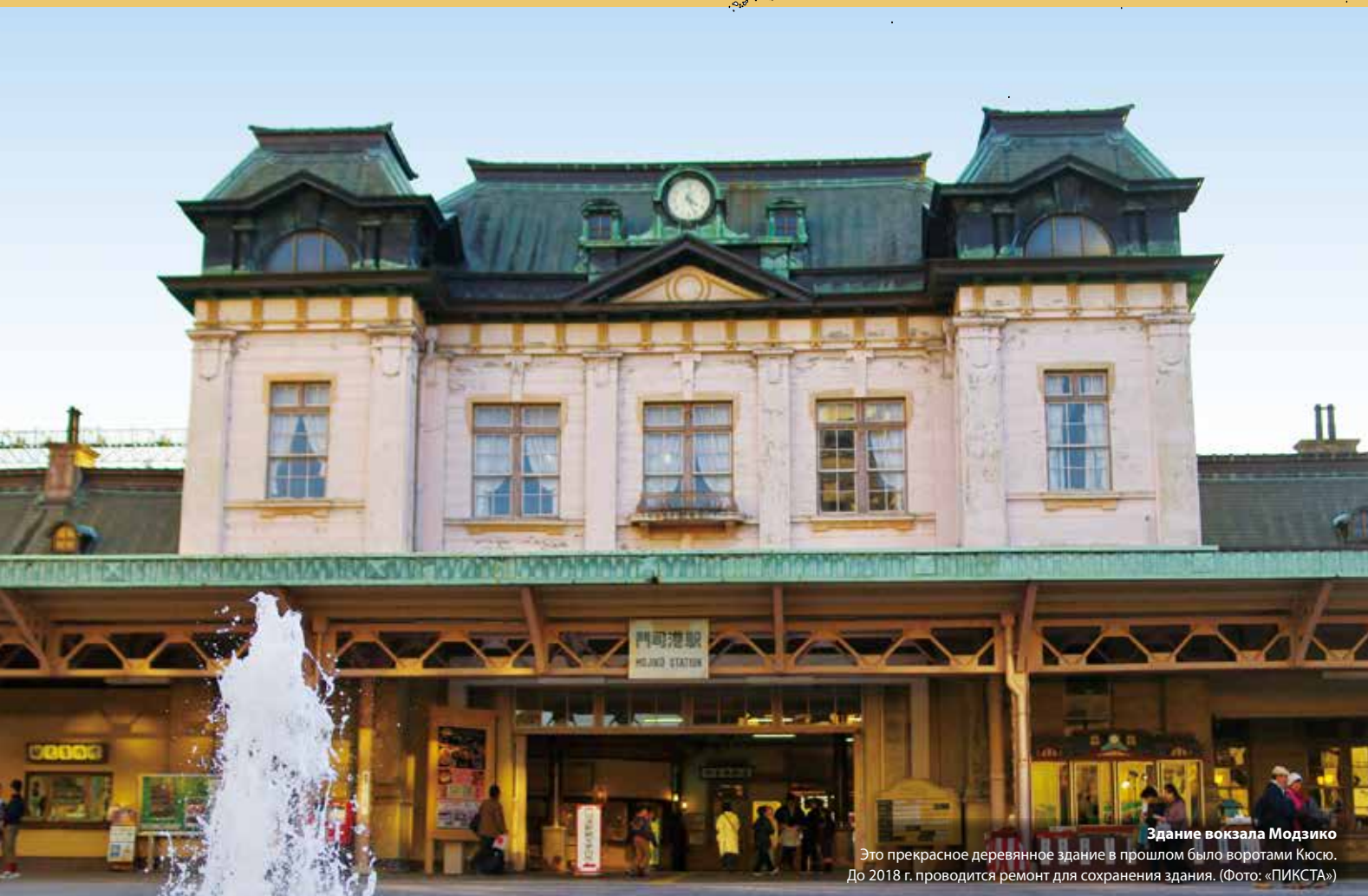
Здание вокзала Модзико Это прекрасное деревянное здание в прошлом было воротами Кюсю. До 2018 г. проводится ремонт для сохранения здания.