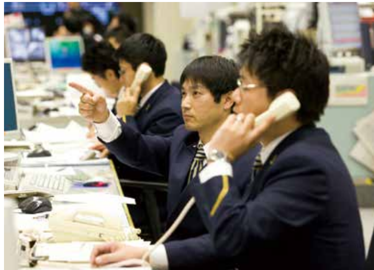
Каждый день с железнодорожной линией Токайдо-синкансэн работает до 432 служб (на октябрь 2016 г.). В случае происшествия диспетчеры разных служб собираются вместе для принятия решений.

Коротко говоря, диспетчеры приобретают опыт, когда график движения поездов срывается тайфуном или другим подобным бедствием. Например, степень скопления пассажиров на платформе постоянно меняется в зависимости от времени года, дня недели, времени суток и других факторов. Невозможно принять решение, как уменьшить это столпотворение, просто управляя передвижением поездов с помощью компьютеров. Чтобы принять самое правильное решение, железнодорожные диспетчеры помимо информации на мониторе также пристально наблюдают за ситуацией на платформе.