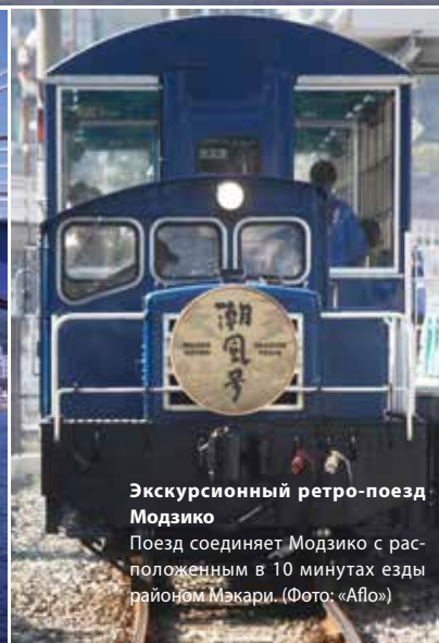
Эксперсионный ретро-поезд Модзико Поезд соединяет Модзико с расположенным в 10 минутах езды районом Мэкари.