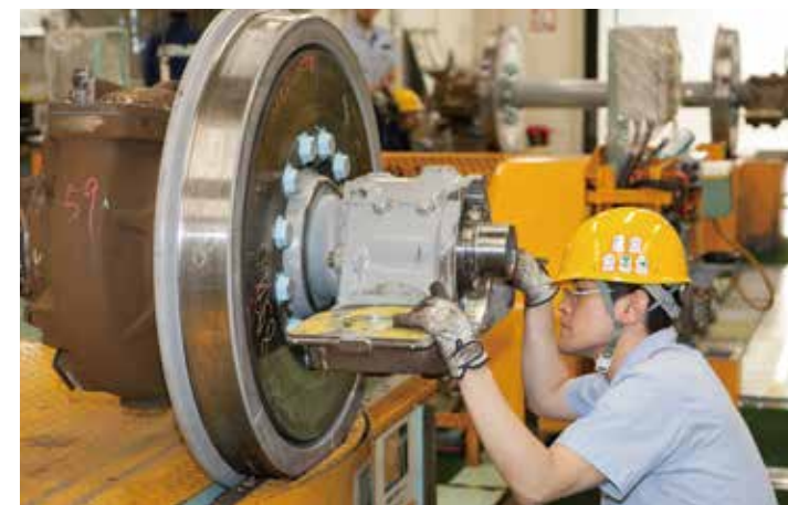
Интерес к исследованиям — одна из характерных черт японцев, которая привела к усовершенствованиям технологий высокоскоростной железной дороги.

* Положение фар еще предстоит определить.