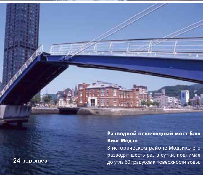
Разводной пешеходный мост Блю Винг Модзи В историческом районе Модзико его разводят шесть раз в сутки, поднимая до угла 60 градусов к поверхности воды.