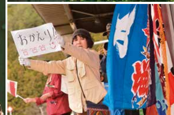
Железная дорога Санрику, проходящая вдоль побережья региона Санрику в префектуре Иватэ. (Вверху)