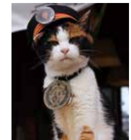
Тама, «Вечный почетный начальник станции»

Крыша станции Киси выполнена в стиле традиционной японской крыши, покрытой корой кипариса, и напоминает по форме кошачью морду.