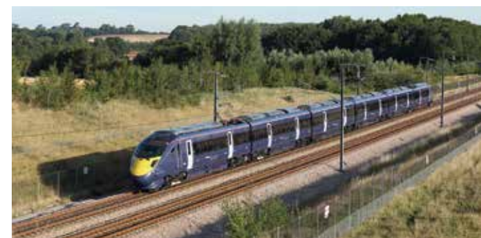
Изготовленные в Японии поезда курсируют по новой высокоскоростной линии, соединяющей Лондон с тоннелем под Ла-Маншем. Эти поезда могут свободно ездить как по обычным, так и по специальным высокоскоростным железнодорожным линиям.

В новом поезде железной дороги Хай Спид 1, соединяющей в Великобритании Лондон с тоннелем под Ла-Маншем, используются высокоскоростные вагоны Class 395, разработанные компанией Хитачи в 2009 г. В поезде применяются технологии экспресса Синкансэн, обеспечивающие максимальную скорость 225 км/ч. Своей исключительной надежностью и точностью движения по расписанию он ничем не уступает японскому экспрессу Синкансэн. В скором времени будет запущен поезд AT-300 — высокоскоростной гибридный поезд с дизельным генератором под дном вагонов.