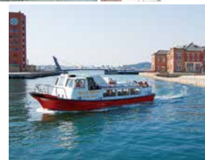
Слева снизу: Ретро-круиз по Модзико. С популярного экскурсионного катера расстилается панорама порта Модзи со стороны моря.