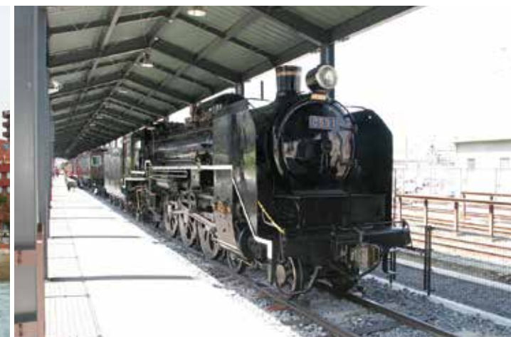
Справа сверху: Музей истории железной дороги Кюсю. На показ выставлены девять вагонов подвижного состава, посмотреть на которые приходят многие любители поездов. На фото — 1-й паровоз серии C59.