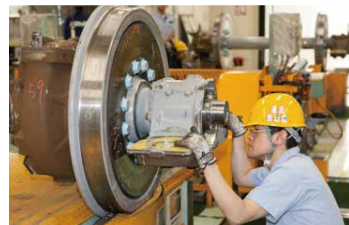
El compromiso que tienen los japoneses con la investigación, uno de sus puntos fuertes, ha conducido hacia las mejoras en la tecnología del ferrocarril de alta velocidad.