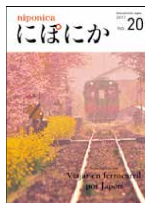
Foto de portada: El ferrocarril de Moka pasando por un túnel de cerezos en flor y flores de canola en primavera.

niponica se publica en japonés y en seis idiomas más (árabe, chino, español, francés, inglés y ruso) con el objetivo de presentar a todo el mundo la gente y la cultura del Japón actual. El título niponica se deriva de la palabra "Nippon", que significa "Japón" en japonés.