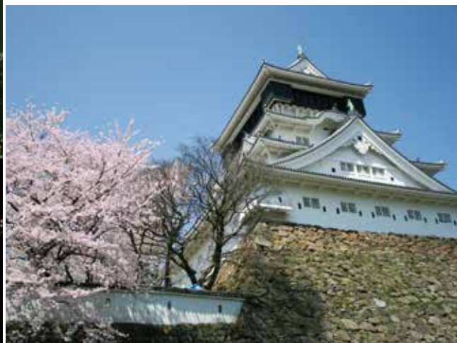
Castillo de Kokura Si no le importa ir un poquito más lejos de Moji, visite Kokura donde se encuentra la Torre del Castillo de Kokura, reconstruida en 1959.