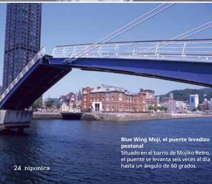
Blue Wing Moji, el puente levadizo peatonal Situado en el barrio de Mojiko Retro, el puente se levanta seis veces al día hasta un ángulo de 60 grados.