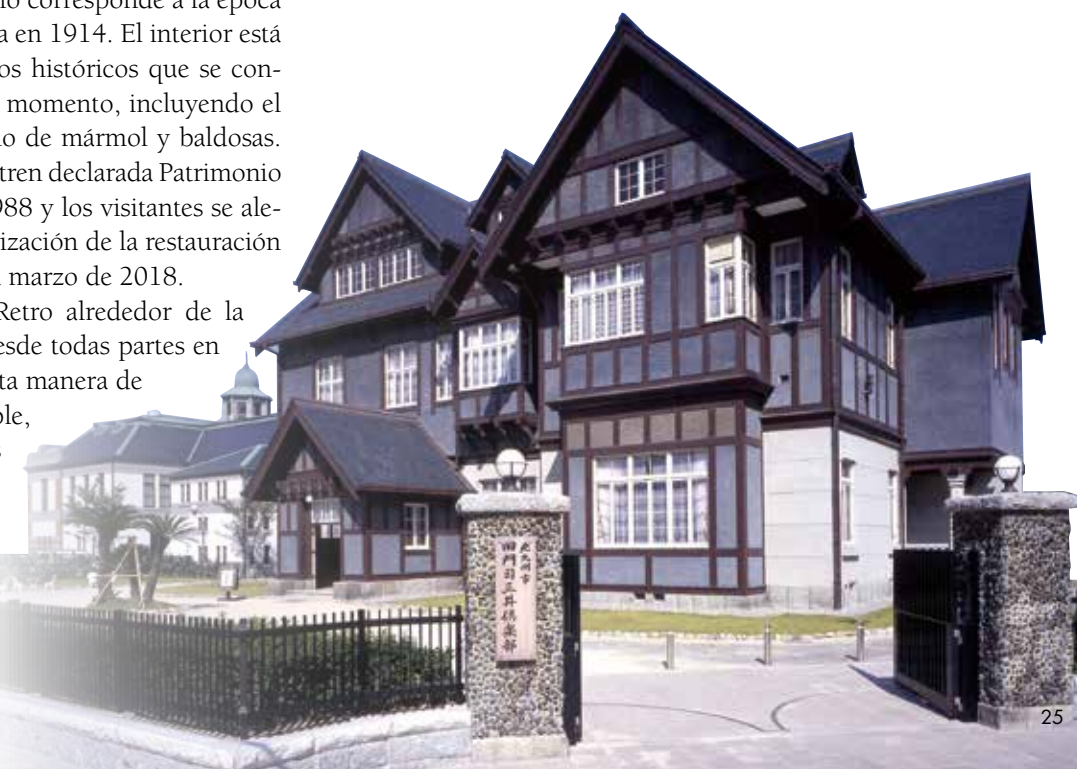
Antiguo Club Moji Mitsui El club social fue construido por una empresa comercial y se ha convertido en Patrimonio Cultural Importante en Japón.

Además de a los japoneses, a los visitantes extranjeros les encantará saber que los antiguos edificios que servían como empresas y oficinas ligadas al tráfico marítimo, bancos y almacenes pueden ser destinados hoy en día a ser ocupados como museos,