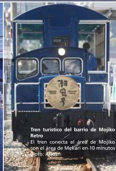
Tren turístico del barrio de Mojiko Retro El tren conecta el área de Mojiko con el área de Mekari en 10 minutos.