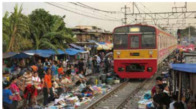
Los trenes japoneses son exportados a Yakarta en Indonesia. Estos trenes antes circulaban en la línea de JR Joban y la línea Chiyoda del Metro de Tokio.

La tecnología japonesa se está introduciendo en países emergentes como Indonesia y Birmania. Se exportan trenes de segunda mano, cuyo servicio finaliza tras la introducción de los nuevos modelos en Japón, junto con la tecnología relacionada con su mantenimiento. Asimismo, en lugar de simplemente limitarse a entregar trenes de segunda mano, se aportan a muchos países del mundo los conocimientos para seguir utilizando estos productos de calidad durante mucho tiempo en el futuro.