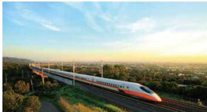
El ferrocarril de alta velocidad en Taiwán ha sido muy elogiado por su exhaustiva tecnología japonesa en aspectos tales como insonoridad, comodidad y puntualidad.

El High Speed 1, la nueva edición del tren que conecta Londres, Reino Unido, con el Eurotúnel, viaja utilizando el coche Class 395 desarrollado por Hitachi, Ltd. en 2009. El tren incorpora la tecnología del Shinkansen que permite alcanzar una velocidad máxima de 225 km/h. Su fiabilidad excepcional y servicio puntual están a la par con los del Shinkansen japonés. En breve se espera la entrada en servicio del AT-300, un tren híbrido equipado con generador diésel instalado debajo del piso.