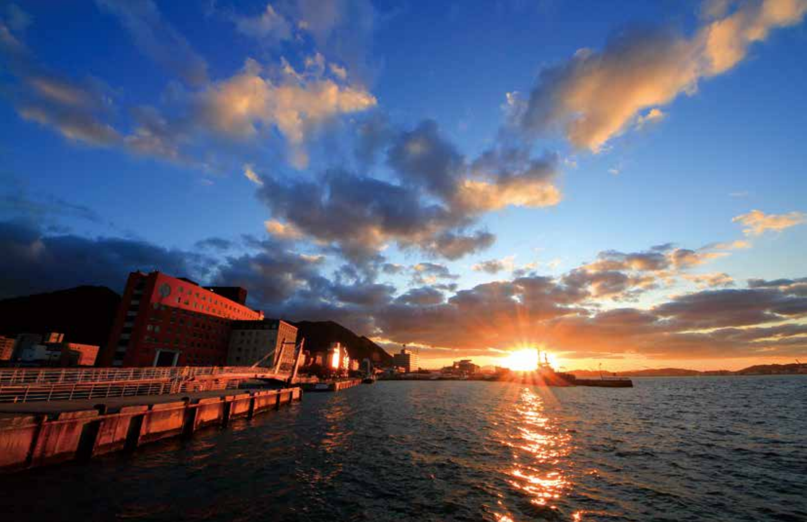
La puesta de sol en el barrio de Mojiko Retro

galerías y restaurantes. Este hecho aumenta más, si cabe, el placer de pasear por esta afable ciudad portuaria. También podrá montar en uno de los richshaws o hacer un crucero y disfrutar de espléndidas vistas a través del ambiente nostálgico del barrio mientras escucha la explicación de un guía turístico.