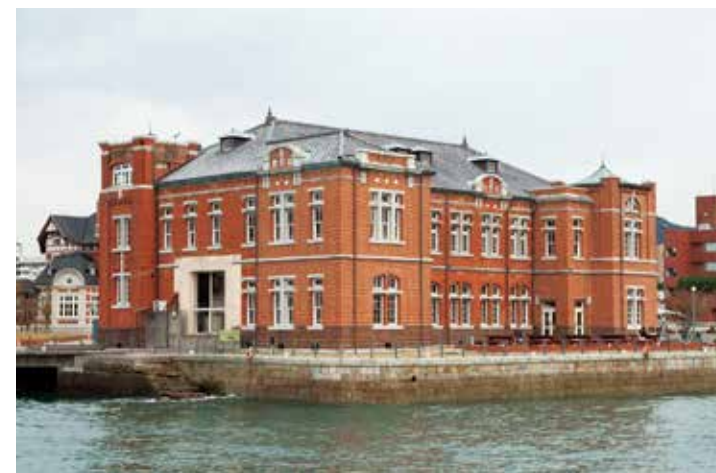
Arriba izquierda: La antigua aduana de Moji El edificio de ladrillos, edificado en 1912, alberga restaurantes y galerías.