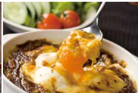
Izquierda: Sashimi y la cazuela de pez globo En Moji, saboree el pescado y marisco fresco del estrecho de Kanmon.