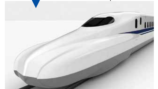
La forma delantera del N700S ha sido evolucionada para suprimir el ruido y la vibración para un viaje más cómodo. * La posición de la luz está por decidir.