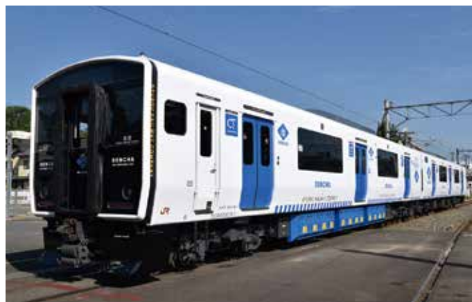
DENCHA circula en Kyushu desde el otoño de 2016.