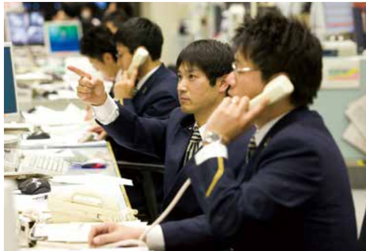
La línea de Tokaido Shinkansen ofrece hasta 432 servicios en un día cualquiera (resultados de octubre de 2016). Cuando algo inesperado ocurre, el personal de control de las diferentes áreas se reúne para tomar decisiones.

En resumen, la experiencia de los controladores es fundamental cuando un tifón u otra adversidad parecida trastornan los horarios de los trenes. Por ejemplo, el grado de congestión en los andenes cambia constantemente según la estación del año, el día de la semana, la hora del día, y de otros factores. No sería posible determinar una manera de minimizar la confusión generada si simplemente se siguieran operando los trenes únicamente mediante los ordenadores. Los controladores examinan las condiciones de los andenes detalladamente, además del monitor, para tomar las decisiones más apropiadas.