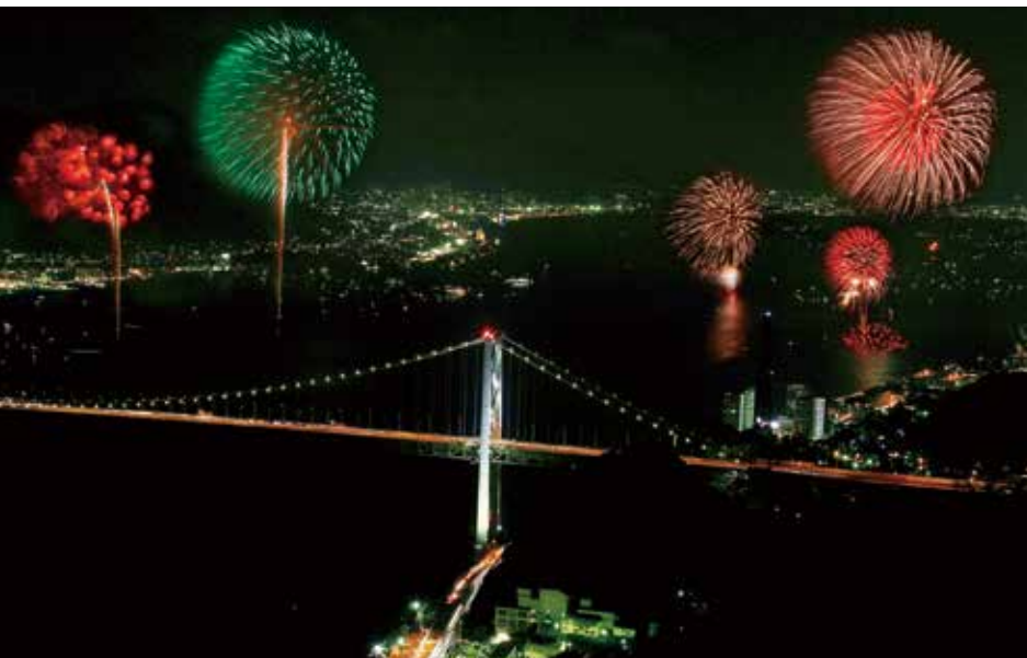
El espectáculo de fuegos artificiales en el estrecho de Kanmon El maravilloso espectáculo de fuegos artificiales que tiene lugar en el estrecho cada agosto es un atractivo del verano.