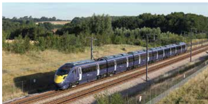
Los trenes fabricados en Japón operan en las líneas de alta velocidad que conectan Londres con el Eurotúnel. Los trenes circulan libremente tanto en las líneas convencionales como en las líneas dedicadas a los trenes de alta velocidad.

La avanzada tecnología de Japón, una gran potencia en ferrocarril, está siendo adoptada activamente por países de todo el mundo. El Taiwan High Speed rail, una compañía ferroviaria inaugurada en 2007, utiliza los vagones del 700T basados en los vagones de la Serie 700 de la línea Tokaido-Sanyo Shinkansen de Japón. Una reputada compañía ferroviaria japonesa también da apoyo en la formación de recursos humanos para asegurar un servicio seguro y puntual. La práctica y la formación únicas y meticulosas de Japón ayudan a fomentar recursos humanos básicos como instructores. No ha habido ningún accidente importante en la línea desde que se inauguró hace 10 años.