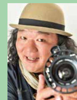
Nakai Seiya Fotógrafo ferroviario

Nacido en Tokio en 1967, fotografía los ferrocarriles desde una perspectiva única. Su arte se extiende a cualquier objeto relacionado con ferrocarriles más allá de los trenes, creando nuevos géneros en el mundo de la fotografía ferroviaria. En su blog, en activo desde la primavera de 2004, sube diariamente sin falta una foto ferroviaria. Además de hacer fotos para anuncios y revistas, está involucrado en muchas actividades incluyendo conferencias y apariciones en televisión. http://railman.cocolog-nifty.com/blog/ (Japonés)