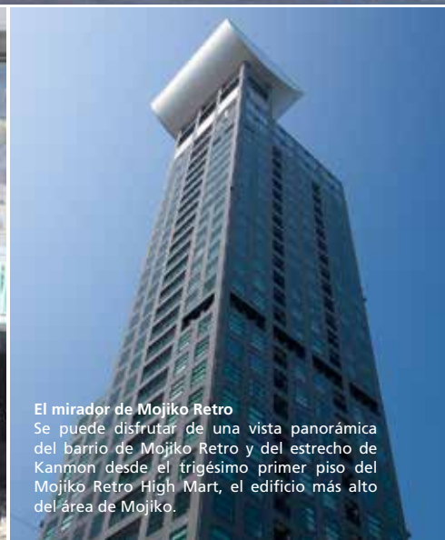
El mirador de Mojiko Retro Se puede disfrutar de una vista panorámica del barrio de Mojiko Retro y del estrecho de Kanmon desde el trigésimo primer piso del Mojiko Retro High Mart, el edificio más alto del área de Mojiko.