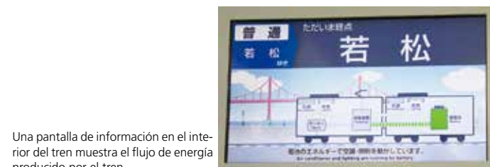
Una pantalla de información en el interior del tren muestra el flujo de energía producido por el tren.