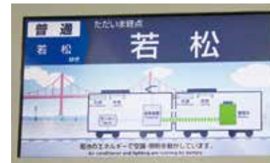
يتم عرض تدفق الطاقة داخل القطار على لوحة المعلومات الموجودة على متن القطار.