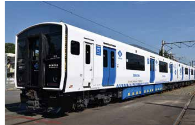
قطار "DENCHA" يؤدي عمله في كيوشو من خريف ٢٠١٦.