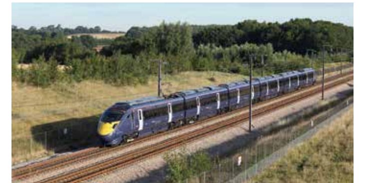
قامت اليابان بتصنيع قطارات عالية السرعة تعمل على الخط الجديد والذي يربط بين مدينة لندن ونفق المانش. يمكن لهذه القطارات السير بحرية على كل من الخطوط التقليدية والخطوط المخصصة للسرعات العالية.

إن النسخة الجديدة للقطار عالي السرعة 1 يقوم بربط مدينة لندن في المملكة المتحدة بنفق المانش مستخدمًا الفئة 395 من العربات عالية السرعة والتي جرى تطويرها من قبل شركة هيتاشي المحدودة في عام ٢٠٠٩. يتضمن القطار على تكنولوجيا شينكانسن التي تصل سرعتها القصوى إلى ٢٢٥ كم/ساعة. يسير كلٌ من عنصرَي الوثوقية الاستثنائية والخدمات التي تتسم بدقة المواعيد على قدم المساواة مع قطارات شينكانسن اليابانية. لم يمضي وقت طويل قبل أن يتم البدء بتشغيل AT-300، القطار الهجين عالي السرعة والمجهز بمولد يعمل على الديزل يسير تحت الأرض.