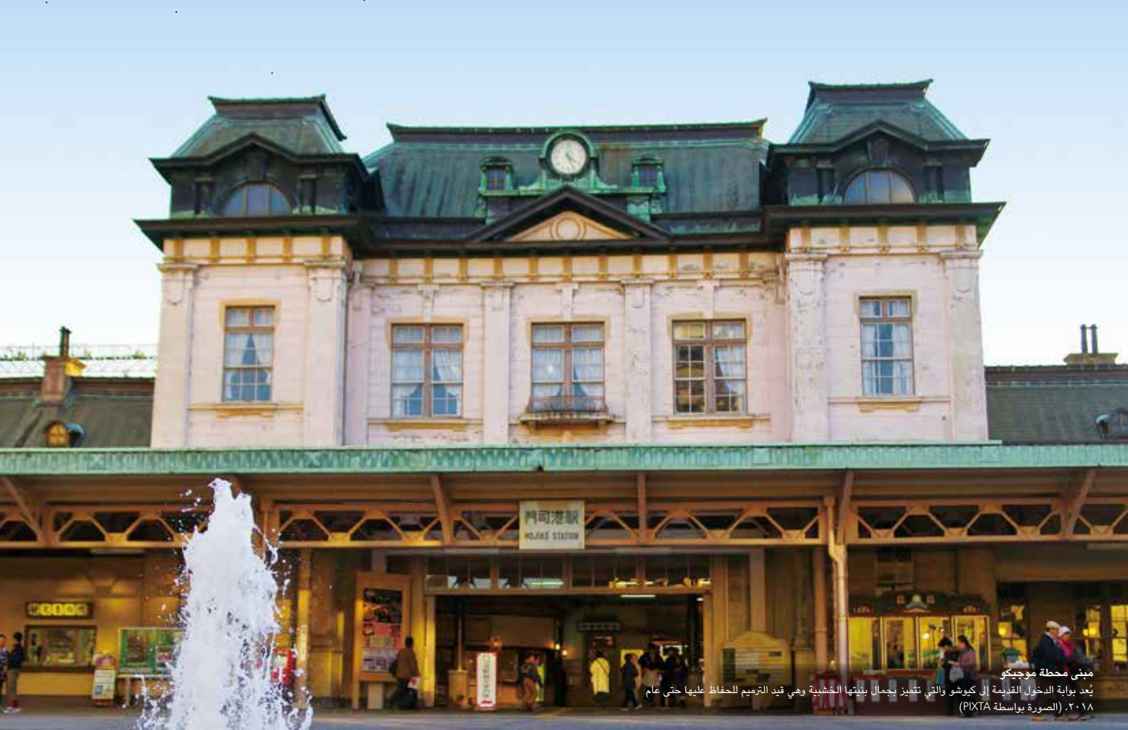
مبنى محطة موجيكو يُعد بوابة الدخول القديمة إلى كيوشو والتي تتميز بجمال بنيةها الخشبية وهي قيد الترميم للحفاظ عليها حتى عام ٢٠١٨.