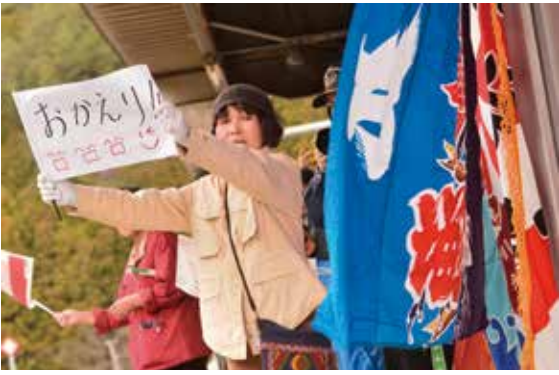
خطوط سكة حديد سانريكو والممتدة على طول ساحل سانريكو التابعة لمحافظة إيواتي (في الأعلى)

سكان المدينة التي تشتهر بصيد الأسماك يرحبون بقدوم القطار بكل سعادة، ويلوحون برايات ملونة تحمل عبارة "صيد وفير" ولافتات محمولة للاحتفال بترميم الخط تمهيداً لمرحلة التشغيل الكامل. (على اليمين والأعلى).