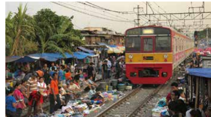
تم تصدير القطارات اليابانية إلى مدينة جاكارتا في إندونيسيا. تم تشغيل هذه القطارات فيما مضى على خط جويان التابع للسكك الحديدية اليابانية وخط تشيودا التابع لطوكيو مترو.

تم توظيف تكنولوجيا السكك الحديدية اليابانية في دول ناشئة مثل إندونيسيا وميانمار. يتم تصدير القطارات المستعملة، والتي أدت دورها وذلك بعد إدخال الموديلات الجديدة في اليابان، جنبًا إلى جنب مع التكنولوجيا المتعلقة بالصيانة كمجموعة واحدة. فبدلاً من الاكتفاء بتسليم القطارات المستعملة فحسب، يتم تزويد العديد من الدول حول العالم بشرح حول الكيفية التي تتم من خلالها مواصلة آلية استخدام المنتجات عالية الجودة على المدى الطويل.