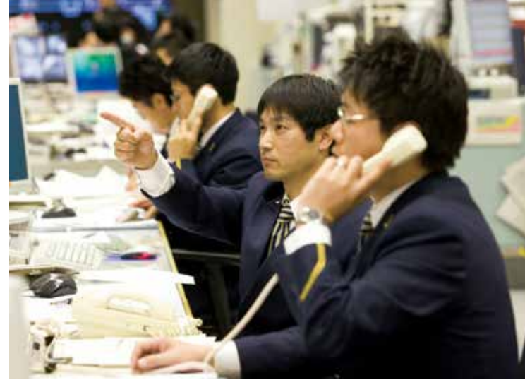
يتم تشغيل ما يصل إلى ٤٢٢ خدمة في يوم واحد، مع خطوط توكايدو شينكانسن (النتائج حتى أكتوبر ٢٠١٦). عند حدوث أمر ما غير متوقع، يتكاتف موظفو المراقبة من مختلف الجالات معًا لاتخاذ القرارات.

بشكل موجز، يمكن القول بأن الخبرة التي يكتسبها مسؤولي التحكم تأتي عند حدوث إعصار أو كوارث مماثلة تؤدي إلى إلغاء مواعيد القطار. وكمثال على ذلك، نجد أن حجم الإزدحام على الرصيف يختلف باستمرار باختلاف فصول السنة وأيام الأسبوع وأوقات محددة في اليوم بالإضافة إلى عوامل أخرى. إنه من غير الممكن ببساطة تحديد الكيفية التي يمكن من خلالها العمل على تخفيف الارتباك عن طريق تحريك القطارات باستخدام أجهزة الكمبيوتر وحدها فقط. يقوم مسؤولي عمليات التحكم في القطارات بإلقاء نظرة عن كثب على أوضاع الرصيف بالإضافة إلى المراقبة وذلك لاتخاذ القرارات الأكثر ملائمة.