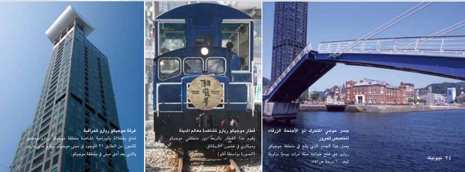
غرفة موجيكو ريترو لمشاهدة معالم المدينة

تمتع بإطلالة بانورامية لمشاهدة منطقة موجيكو ريترو ومضيق كانمون من الطابق ٣١ الموجود في مبنى موجيكو ريترو هاي مارت، والذي يعد أعلى مبنى في منطقة موجيكو.