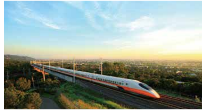
لاقت السكك الحديدية عالية السرعة في تايوان ترحيبًا كبيرًا إثر توظيفها للتكنولوجيا اليابانية الشاملة في جوانب تتضمن عناصر عدة مثل الهدوء والراحة والخدمة التي تتسم بالدقة.

إن التكنولوجيا المتقدمة في اليابان، والتي تُعد القوة الكامنة والجوهرية في السكك الحديدية، أصبحت متداولة بشكلٍ جدي في جميع أنحاء العالم. تقوم السكك الحديدية اليابانية عالية السرعة، والتي بدأت عملها في عام ٢٠٠٧، باستخدام عربات من الطراز 700T وذلك استنادًا إلى العربات من السلسلة 700 المستخدمة في خطوط توكايدو-سانيو شينكانسن اليابانية. تساهم شركة سكة الحديد اليابانية إلى جانب النتائج المثبتة كذلك في تطوير الموارد البشرية وذلك لتحقيق عنصر السلامة وتوفير خدمة تتسم بالدقة. لقد ساعدت الخبرة اليابانية الفريدة والدقيقة إلى جانب التدريب في تعزيز الموارد البشرية الأساسية للعمل كمدرّبين. حتى هذه اللحظة، لم يتم تسجيل أية حوادث جسيمة وقعت على الخط منذ افتتاحه قبل نحو ١٠ سنوات.