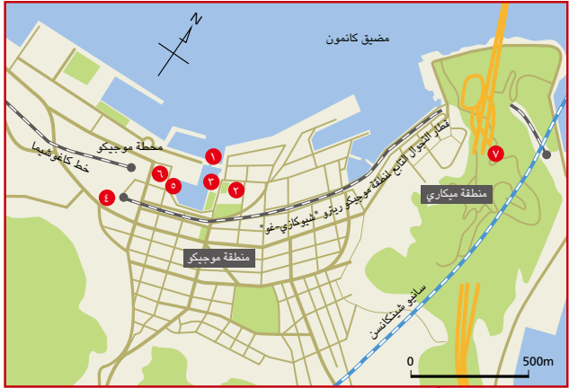
منطقة موجيكو ريترو