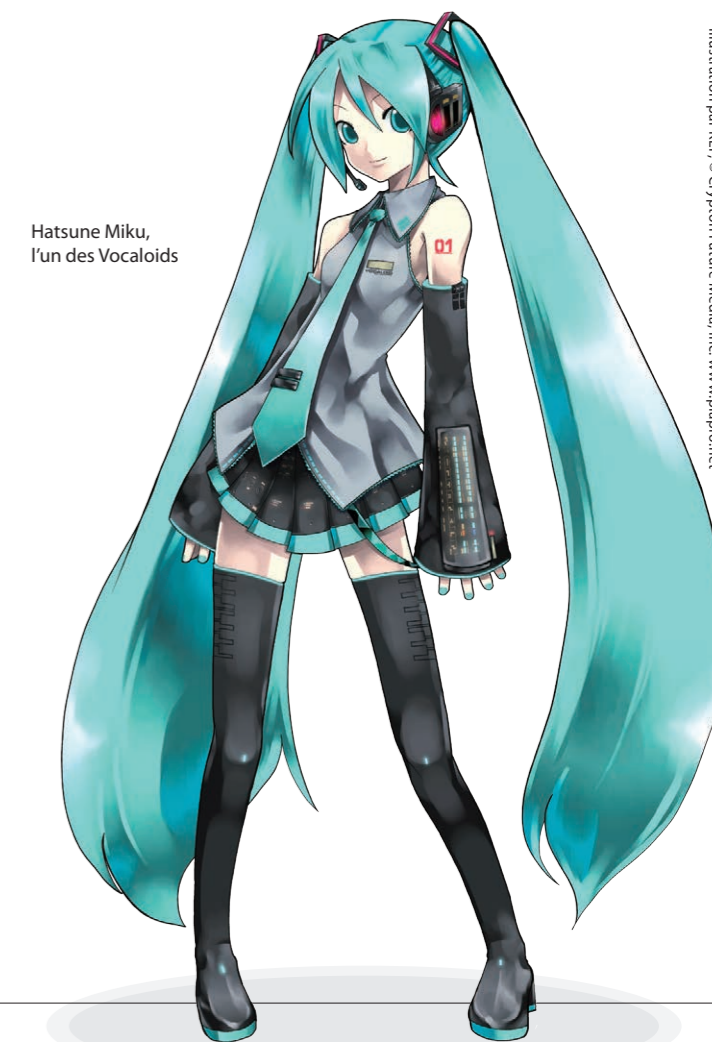
Hatsune Miku, l'un des Vocaloids

Grâce à la vente de CD compilation, à des spectacles et à des collaborations avec des sociétés, la popularité de Hatsune Miku a atteint celle d'artistes en chair et en os, et même davantage. Avec l'Internet, cette popularité a gagné et s'est répandue dans toute l'Europe, l'Amérique et l'Asie. Aux États-Unis, en 2011, Hatsune Miku a été utilisée dans une publicité pour une voiture japonaise.