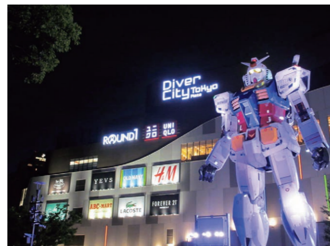
Statue Gundam grandeur nature, de 18 mètres de haut, au Gundam Front Tokyo

sonnalité. À Harajuku, chacun porte ce qu'il pense être kawaii. C'est en fait très important. J'espère qu'un jour chacun pourra porter les vêtements qu'il ou elle aime, non seulement à Harajuku, mais dans tout le Japon. »