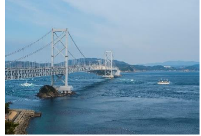
시코쿠의 나루토 대교 (오나루토교 다리)

도쿠시마현과 효고현의 아와지시마를 연결하는 나루토해협은 거대한 소용돌이로 유명하다.