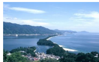
교토부 아마노하시다테

과거 794년에서 1868년까지 천황이 살던 일본의 수도였던 교토는 사원, 신사 및 그 밖의 역사적인 유적지로 유명하며, 국보와 황실 문화유산으로서 공식적으로 지정되어 있는, 사실상의 보고이다. 교토는 유명한 관광지로서 일본 전역과 전 세계에서 매년 수백만 명의 관광객을 끌어 모은다. 고대 교토의 문화제는 1994년 세계유산으로 지정되었다.