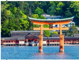
히로시마 이쓰쿠시마신사 (미야지마)