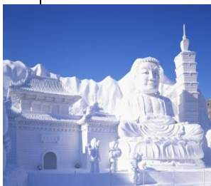
삿포로 눈축제

간토지방은 혼슈의 남동쪽 지방으로 일본에서 가장 큰 평야인 간토평야가 있다. 기후는 일반적으로 온화하며 사계절이 뚜렷하다. 도쿄, 요코하마, 가와사키, 사이타마 및 지바와 같은 중요 도시를 포함하는 이 지방은 일본에서 가장 인구 밀도가 높은 곳이다. 이 지방의 중심인 도쿄 - 요코하마는 일본의 상업과 산업의 심장부이다. 도쿄 만의 해안을 따라 뻗어 있는 게이힌공업지대와 게이요공업지대는 일본에서 가장 큰 산업지대를 형성한다.