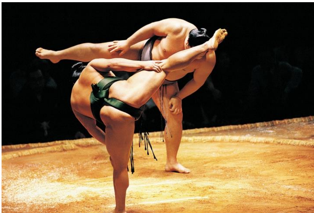
Juste avant la lutte