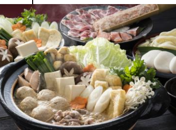
Le chanko Nabe est une soupe hochepot traditionnelle pour les lutteurs de sumo.

Le sumo est particulièrement admiré pour sa noblesse et la maîtrise de soi qu'il requiert. On n'a jamais entendu parler de contestations à propos d'une décision d'arbitrage ou de manque de fair-play. Alors que les claques, souvent vigoureuses, à mains ouvertes sur le haut du corps sont autorisées, les coups de poing ou de pied ainsi que le tirage des cheveux sont strictement interdits. Bien que le résultat d'une rencontre soit parfois très incertain et que la décision de l'arbitre puisse être revue (et parfois même inversée) par les juges, les protagonistes ne protestent jamais, et manifestent rarement une émotion, en dehors d'un bref sourire ou d'un froncement de sourcils.