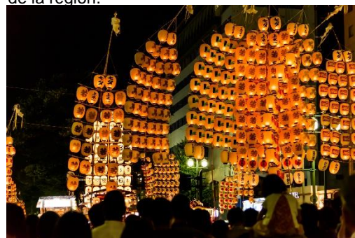
Kanto Matsuri dans la préfecture d'Akita