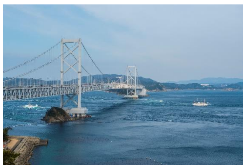
Le pont de Naruto Ohashi à Shikoku

La passe de Naruto, qui relie la préfecture de Tokushima à Awajishima, île située dans la préfecture de Hyogo, est réputée pour ses violents tourbillons.