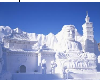
Le Festival de la Neige à Sapporo

Matsushima, un ensemble de plus de 260 petites îles dans la préfecture de Miyagi, compte parmi les trois plus beaux sites du Japon. L'impact et les dégâts du tsunami consécutif au grand séisme de l'Est du Japon ont été limités grâce aux particularités géologiques de la région. Par train, Matsushima est à 40 minutes environ de Sendai. Chaque été, trois grands festivals pittoresques se déroulent dans la région du Tohoku. Il s'agit du Nebuta Matsuri, organisé à Aomori et Hirosaki, du Tanabata Matsuri à Sendai et du Kanto Matsuri à Akita.