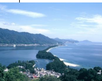
Amanohashidate au nord de la préfecture de Kyoto

Cette région est constituée de Shikoku (la plus petite des quatre îles principales de l'Archipel) et des différentes îles qui