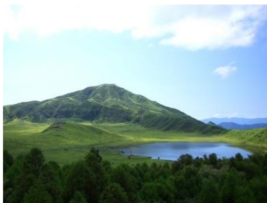
Le Mont Aso dans la préfecture de Kumamoto

La préfecture d'Okinawa est un chapelet de 60 îles très éloignées, dans le Sud de Kyushu. Okinawa, autrefois appelée Ryukyu, était un royaume indépendant jusqu'au 17 ème siècle et, en tant que tel, développa son propre dialecte et ses propres traditions culturelles. Après la seconde guerre mondiale, et jusqu'en 1972, Okinawa était placée sous administration américaine. Le tourisme y est la principale ressource. Grâce au climat agréable qui y règne toute l'année, les sports aquatiques y sont très prisés. On y trouve de très belles îles telles que Ishigakijima et Miyako-jima, connues pour leurs récifs coralliens.