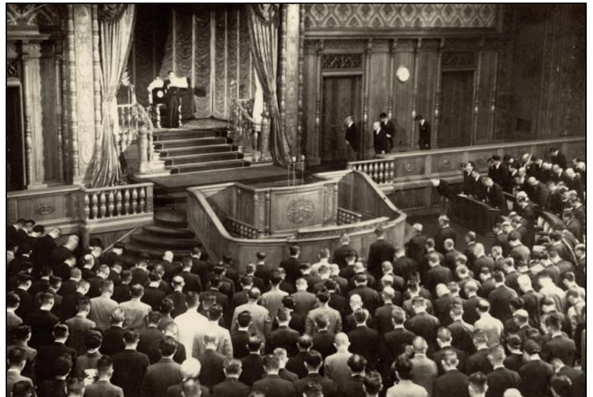
Première séance de la Diète régie par la nouvelle Constitution du Japon

Nous croyons qu'aucune nation n'est responsable uniquement envers elle-même, qu'au contraire les lois de la moralité politique