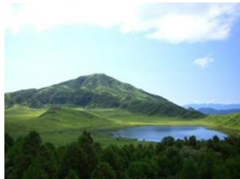
El Monte Aso, en la prefectura de Kumamoto

El estrecho de Naruto, que separa la prefectura de Tokushima de Awajishima, en la prefectura de Hyogo, es conocido por sus enormes remolinos.