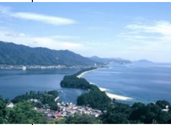
Amanohashidate en el norte de la prefectura de Kyoto

montañosa región es el monte Fuji. Es la montaña más alta del país (3.776 metros; 12.388 pies) y también la más famosa, considerada como sagrada por algunos japoneses. Su forma cónica ha inspirado a generaciones de artistas y es reconocida en el mundo como símbolo de Japón. En 2013, el Comité del Patrimonio Mundial decidió inscribirse en el patrimonio de la humanidad como fuente de arte y objeto de la fe en Monte Fuji. La propiedad consta de 25 sitios que reflejan los factores de la fe en Monte Fuji y paisaje artístico. Monte Fuji, ha sido durante mucho tiempo objeto de peregrinaciones y además, ha influenciado en las artes y poesías. Durante la temporada de alpinismo, del 1 al 10 de septiembre, está llena de montañistas. Otros lugares turísticos en la región de Chubu son la península de Izu, en la prefectura de Shizuoka, que tiene clima subtropical, muchas playas hermosas y un gran número de balnearios de aguas termales, así como Zenkoji, en la prefectura de Nagano, un conocido templo que atrae a gran número de visitantes provenientes de todo el país.