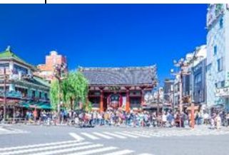
Asakusa en Tokio