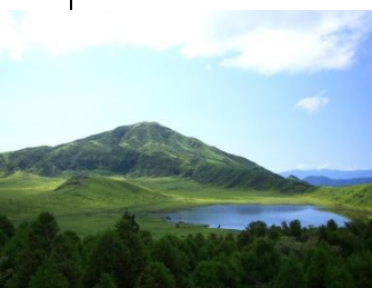
El Monte Aso, en la prefectura de Kumamoto

Shikoku (la más pequeña de las cuatro islas principales de Japón), junto con varias islas marginales, conforma la región homónima que se extiende a lo largo del Mar Interior. Las altas y escarpadas montañas sirven