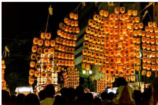
El Kanto Matsuri en la prefectura de Akita

realizado en Aomori y Hirosaki; el Tanabata Matsuri, en Sendai y el Kanto Matsuri en Akita.