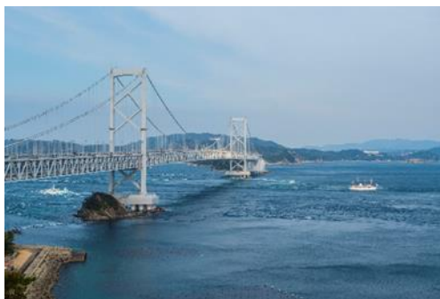
El puente Naruto-Ohashi en Shikoku

El estrecho de Naruto, que separa la prefectura de Tokushima de Awajishima, en la prefectura de Hyogo, es conocido por sus enormes remolinos.