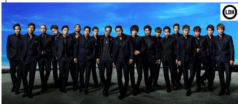
舞蹈&唱歌组合 放浪兄弟(EXILE) 在音乐会中气势恢宏的舞蹈表演深受观众欢迎。

从2000年代后半期开始,从普通市民到专业人士之间都兴起了通过音乐合成软件制作音乐的热潮,其中以虚拟偶像“初音未来”为代表,只要输入旋律和歌词就能合成人类嗓音所唱的歌曲。