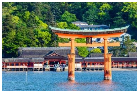
广岛的严岛（宫岛）神社

成了其独特的方言和文化传统。二战结束后，冲绳一直为美军所管制，直到1972 年，日本才恢复对冲绳行使主权。旅游业为该地区的主导产业。由于全年气候温暖，因而水上运动颇为人们喜爱。冲绳有许多美丽的岛屿，如其中的石垣岛和宫古岛，就以珊瑚礁而闻名。