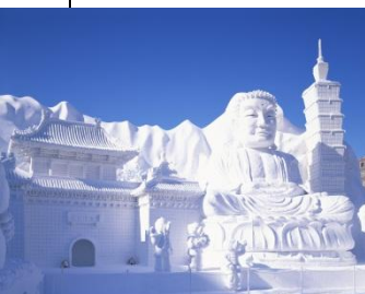
札幌冰雪节

东京还因是日本的文化和娱乐中心而闻名。丰富多彩的现代艺术和传统艺术在这里展现，古典音乐和流行音乐的旋律在一家又一家音乐厅里飘荡，博物馆和美术馆星罗棋布，让人流连忘返。称为“鸽子(Hato)”的城市观光大