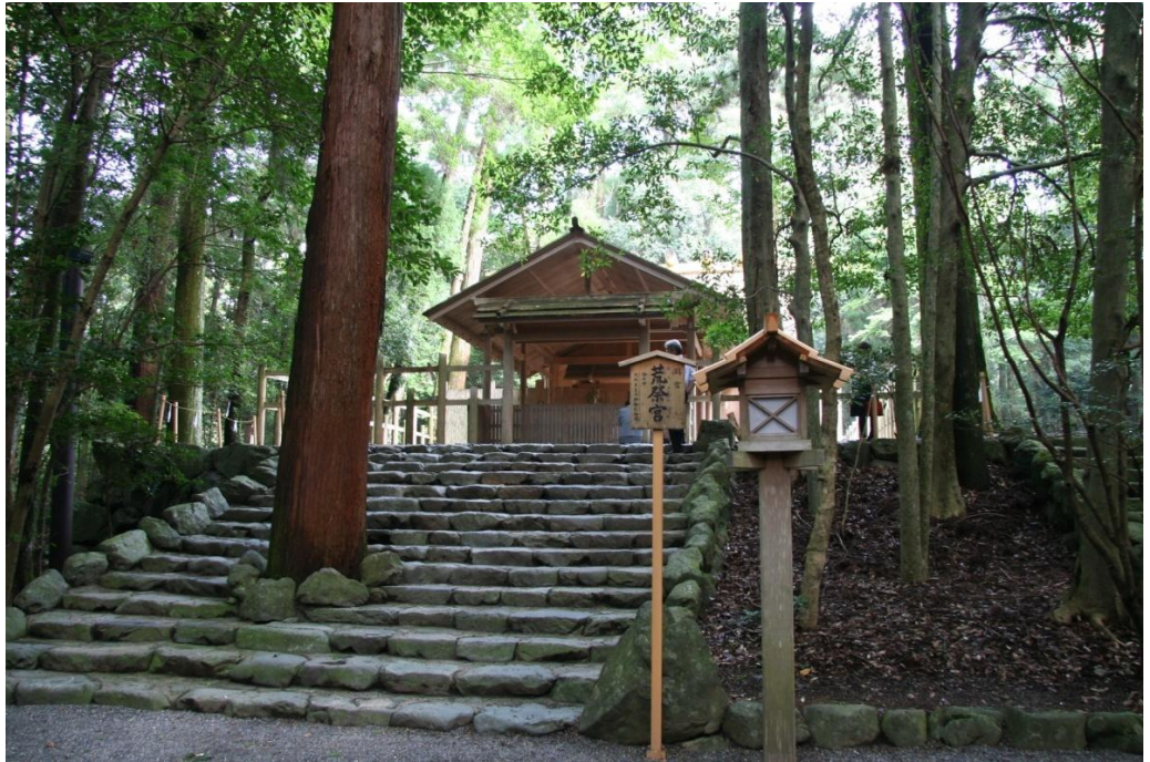
이세신궁 아라마쓰리아 궁 신도의 중심적 역할을 담당하는 이세신궁에는, 일본 황실의 조상신의 하나로 불리어지는 아마테라스 오미카미를 모시고 있다.

일본에서 종교는 종교적 전통들이 상호 영향을 주고 받은 오랜 역사를 가지고 있다. 기독교가 지방 이교도 전통을 지배했던 유럽과는 달리 일본의 고유한 종교인 신도는 일본에 국가가 성립되었던 시초부터 오늘날까지 사람들의 생활의 일부가 되어 왔다.