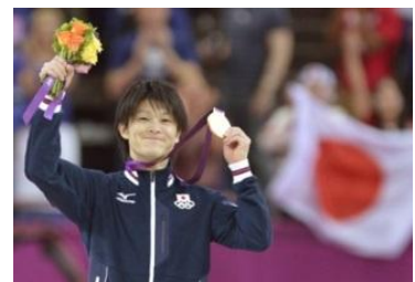
런던올림픽 체조 남자 개인종합에서 금메달을 차지한 우치무라 고헤이 선수

2016년 리우데자네이로 올림픽에서 일본은 41개의 메달(금메달 12개, 은메달 8개 및 동메달 21개)을 땀으며 특히 팀 종목에서 뛰어난 결과를 얻었다. 일본은 남자 체조 단체