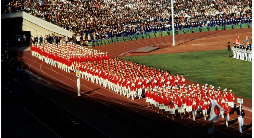
1964년 도쿄 올림픽 개막식 93개국에서 온 5,152명의 선수들이 20가지 경기에서 경쟁하였다.