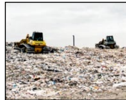
Décharge sur la digue centrale extérieure

Cette énorme décharge située sur les terrains gagnés sur la mer dans la Baie de Tokyo est utilisée pour l'élimination des déchets solides produits par les 23 arrondissements de la capitale.