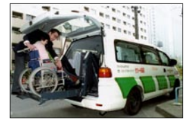
Véhicules sanitaires Des véhicules dotés d'équipements spéciaux pour le transport des chaises roulantes sont utilisés pour assurer le transport des personnes handicapées.

Les personnes considérées comme des handicapés physiques ont droit à divers services d'assistance publique : conseils et consultations, rééducation spécifique et services médicaux,