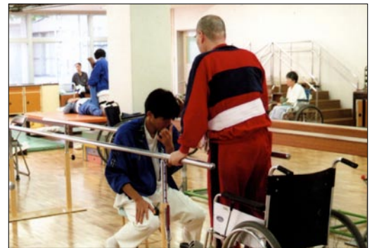
Centre de rééducation

Pour faire face au vieillissement de la société au 21 e siècle, le gouvernement japonais a établi, en 1989, une stratégie sur dix ans (communément appelée le « Plan en or ») destinée à promouvoir les soins de santé et l'assistance aux personnes âgées. Ce plan a été révisé en 1994 et pris le nom de Nouveau Plan en or. Ce dernier plan connut diverses améliorations lors de l'année fiscale 1999, comme l'augmentation du nombre des aides à domicile pour les personnes âgées, l'amélioration des capacités d'accueil pour les personnes âgées dans les centres de séjours de courte durée assurant repos et soins spécifiques, l'offre de services journaliers (repas et exercices physiques entre autres) dans les centres de service de jour, l'augmentation des services à