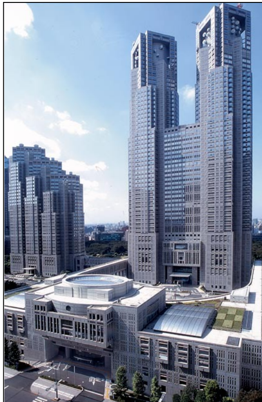
Quartier général des autorités qui gouvernent la métropole de Tokyo.

Le ministère des Affaires intérieures et des Communications est l'organe de gouvernement central qui contrôle les questions d'administration locale. Sa responsabilité relève essentiellement de trois bureaux du