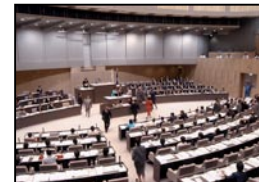
L'Assemblée Métropolitaine de Tokyo

Afin de répondre aux différentes réclamations des citoyens à l'encontre des instances locales, une organisation a été mise en place pour utiliser les services d'un médiateur chargé d'enquêter auprès des administrations locales ; Kawasaki, préfecture de Kanagawa, ayant été la première ville à bénéficier de ce système en 1990. Le médiateur possède un large pouvoir d'investigation pour traiter les réclamations, et dans le cas où le bien-fondé de la plainte est reconnu, à la suite d'un défaut du système ou à des imperfections de l'administration, il est tenu de rendre un avis public et d'inciter les responsables administratifs locaux à remédier au problème posé.