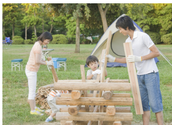
Une famille qui prépare un feu de camp pendant un jour de congé

Dans les années 1970, les activités de loisirs dites "bon marché, bien situées et courtes", à savoir pratiquer un sport, se rendre dans les arcades de jeux ou fréquenter les centres culturels, étaient les plus populaires. L'année 1983, qui vit les débuts sur le marché des consoles de jeux vidéo pour ordinateur familial, marque le départ du développement d'une vaste gamme de consoles de jeux. Cette même année,