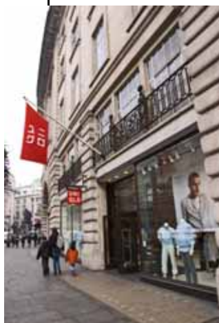
UNIQLO s'implante outre-mer (photo de son magasin de Regent Street à Londres)

D'autre part, depuis le début des années 80, les frictions commerciales, particulièrement avec les États-Unis, sont le plus souvent dues aux tentatives d'augmenter les exportations vers le Japon en donnant aux compagnies étrangères un meilleur accès au marché japonais et en éliminant les « barrières non tarifaires ». Cherchant à ouvrir son marché, le gouvernement japonais a pris toute une série de mesures politiques : diminutions unilatérales des tarifs douaniers, suppression des restrictions à l'importation, réforme du système de certification standard,