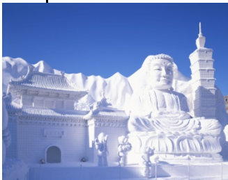
Le Festival de la Neige à Sapporo

Matsushima, un ensemble de plus de 260 petites îles dans la préfecture de Miyagi, compte parmi les trois plus beaux sites du Japon. L'impact et les dégâts du tsunami consécutif au grand séisme de l'Est du Japon ont été limités grâce aux particularités géologiques de la région. Par train, Matsushima est à 40 minutes environ de Sendai. Chaque été, trois grands festivals pittoresques se déroulent dans la région du Tohoku. Il s'agit du Nebuta Matsuri, organisé à Aomori et Hirosaki, du Tanabata Matsuri à Sendai et du Kanto Matsuri à Akita.