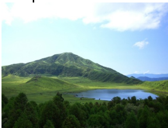
Le Mont Aso dans la préfecture de Kumamoto

Cette région est constituée de Shikoku (la plus petite des quatre îles principales de l'Archipel) et des différentes îles qui l'entourent, le long de la Mer Intérieure. Ses hautes montagnes escarpées rendent difficile l'implantation de fermes et d'habitations ; et il y a peu d'industries à grande échelle. Toutefois, on s'attend à ce que de nouvelles industries y fassent leur apparition grâce aux deux ponts récemment achevés (Seto Ohashi) qui relient Shikoku et Honshu. Le climat sur la Côte Pacifique de Shikoku est subtropical.