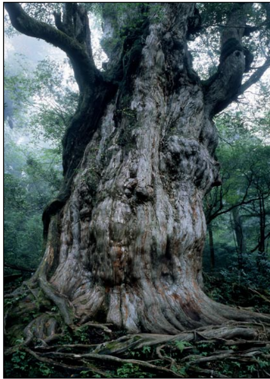
Cèdre (Préfecture de Kagoshima) Connu sous le nom de Cèdre Jomon, cet arbre de l'île de Yakushima serait âgé de 7 200 ans et a une circonférence de 16,4 mètres.

S'il est une plante particulièrement représentative du Japon, c'est le sakura (cerisier). Le sakura , qui est originaire du Japon, est de loin la plante préférée des Japonais, et ce depuis l'antiquité. Les Japonais d'aujourd'hui accueillent la floraison des cerisiers au printemps comme une opportunité de faire hanami (réunions pour admirer les cerisiers en fleurs), et de nombreuses manifestations, comme les cérémonies d'intronisation dans les écoles ou les entreprises, ont lieu à cette saison. Les prévisions météorologiques à la télévision ou dans la presse écrite font état de l'avancée du « front des cerisiers » alors qu'il se déplace vers le nord, commençant à Okinawa pour prendre fin en