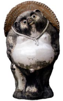
Céramique tanuki (chien viverrin) Portant des chapeaux de paille et des jarres de sake, ils étaient traditionnellement placés devant les débits de boissons.

Les enseignements bouddhistes ont influencé l'attitude de leurs adeptes vis-à-vis du règne animal. Par exemple, jusqu'à la fin du 19 ème siècle, pratiquement aucun Japonais n'aurait abattu un animal à quatre pattes, préférant le poisson pour les protéines animales. Ensuite, il y a le cycle de 60 ans qui régit l'ancien calendrier chinois, dans lequel un animal (rat, buffle, tigre, lièvre, dragon, serpent, cheval, chèvre, singe, coq, chien et sanglier) représente chaque subdivision de 12 ans. L'année 1998 était celle du tigre, et l'année suivante celle du lièvre. Même aujourd'hui, chacun associe son année de naissance à celle de l'animal du zodiaque chinois qui lui correspond — déclarant, par exemple « Je suis né l'année du cheval » — et il est admis que la personnalité et la bonne fortune de chaque individu sont influencées par l'animal qui correspond à l'année de sa naissance.