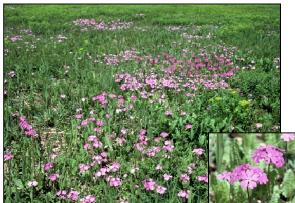
Un champ de Sakuraso , une espèce de primevère.

Les figures animales sont importantes dans la culture de l'Archipel. La littérature classique chinoise est source de maintes croyances que les Japonais ont adoptées concernant divers animaux. Dans les périodes protohistorique et ancienne, l'élite japonaise s'est appropriée certains symboles animaliers venus de Chine comme la grue et la tortue (pour le bonheur et la longévité) ou encore