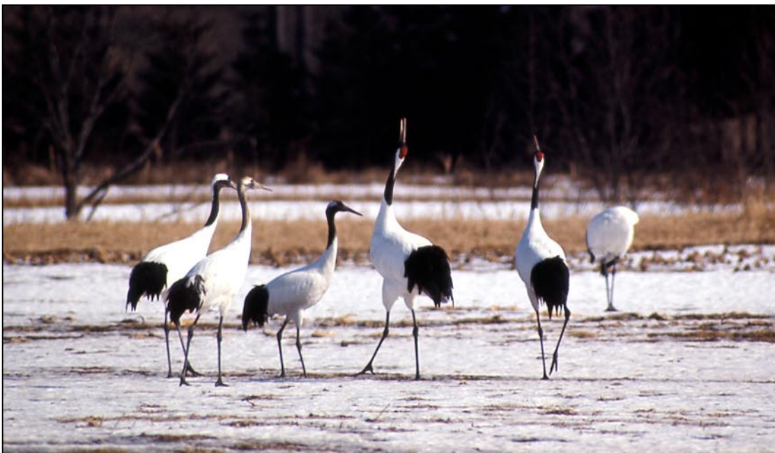
Grues du Japon, marais de Kushiro (Préfecture d'Hokkaido)

Espèce protégée au Japon, cette grue est rare et se reproduit seulement en Sibérie et à Hokkaido.