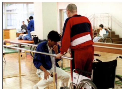
Centro de rehabilitación

Para hacer frente al problema del envejecimiento de la sociedad en el siglo XXI, el Gobierno japonés instituyó en 1989 la Estrategia de Diez Años para la Promoción del Cuidado de la Salud y la Asistencia Social para Ancianos (conocido comúnmente como Plan de Oro). Este plan fue revisado en 1994 y recibió el nombre de Nuevo Plan de Oro. El Nuevo Plan de Oro introdujo varias mejoras en el año fiscal 1999, entre ellas, el incremento del número de asistentes a domicilio para ancianos, mejoras en la capacidad de las instalaciones de corta estancia con objeto de acogerlos para periodos de descanso y cuidados especiales, la oferta de servicios diurnos (incluidos comidas y ejercicio físico) en los centros de servicio de día, y la ampliación