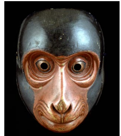
Máscaras de noh y kyogen (Izquierda) Una máscara noh ko-omote para papeles de mujer joven. (Derecha) Una máscara de mono del kyogen . © Teatro Nacional de Noh

El personaje de Taro-kaja es una clase de hombre normal que, aunque nunca escapa a su destino de ser un criado, siempre se las arregla para que su vida sea un poco más agradable adelantándose siempre a su amo.