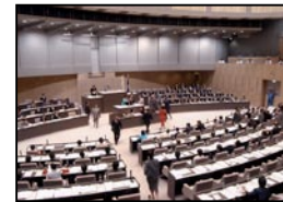
Asamblea del Área Metropolitana de Tokio

Como reflejo de la necesidad de dar respuesta a las quejas de varios residentes acerca de los gobiernos locales, en 1990 se implementaron (en la ciudad de Kawasaki, prefectura de Kanagawa) algunos mecanismos para crear la figura del ombudsman o “defensor del pueblo” encargado de investigar cuestiones de la administración local. Este funcionario tiene poder de investigación conducente a la resolución de conflictos, y en aquellos casos donde se determina que los motivos de la querrela efectivamente tienen sustento en los defectos del sistema o en fallos en la administración, el ombudsman o “defensor del pueblo” expondrá a conocimiento público sus puntos de vista y recomendará al titular de la administración local la solución de los problemas objeto de investigación.