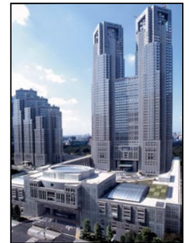
Oficinas centrales del gobierno metropolitano de Tokio

En abril de 2000 un paquete de revisiones de leyes relacionadas con la descentralización se implementó y otorgó un amplio marco de operaciones administrativas del Gobierno central a los gobiernos locales. Como una parte de la