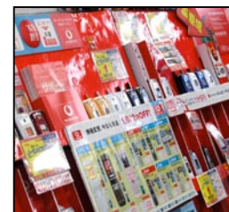
Teléfonos móviles Tarifas bajas y una variedad de servicios han acelerado la venta de teléfonos móviles.

Mirando hacia el futuro de las emisiones terrestres digitales de radio y TV que se introdujeron gradualmente entre 2003 y 2006, una revisión de 1999 en la Ley de Emisiones hizo posible que se emitieran varios tipos de datos como parte de la señal digital, aunque aquellos datos no estaban relacionados con el contenido de imagen y sonido del programa.