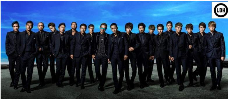
舞蹈&唱歌组合 放浪兄弟 (EXILE) 在音乐会中气势恢宏的舞蹈表演深受观众欢迎。

至二十世纪初叶,日本出现了数量众多的西方古典音乐的行家里手,吸引了欧洲音乐界人士的注意,一些人来日本举办个人独奏会或进行音乐巡回演出。1926年,新交响乐团成立。1927年,开始定期演出。1951年,该交响乐团更名为NHK交响乐队。如今,NHK交响乐队由NHK广播协会主办,是日本的顶级乐队。1950年以来,日本现代音乐联盟每年举办音乐节以促进作曲业的发展。著名的战后作曲家包括:团伊玖磨,根据一个日本民间传说创作了充满美丽的歌剧《夕鹤》(1952年);和黛敏郎,受佛教深奥教义的启发写了许多交响乐章。武满彻,一位受人尊敬的先锋派作曲家,也因谱写了很多电影音乐而闻名于世。许多日本音乐人远赴海外留学,其中有些人,如指挥家小泽征尔、小提琴演奏家五岛MIDORI和钢琴家内田光子,赢得了经久不衰的国际声誉。