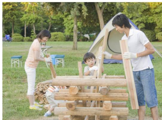
假日，为营火做准备的家人

才艺的劲头也十足，他们充分利用地区的文化中心或大学的市民讲座等，就各自关心的主题积极开展活动，活到老学到老。