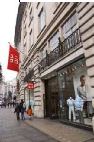
优衣裤向海外发展 (图为设在英国的摄政街分店)

在日本的国际收支平衡表中,经常性转移支付差额和服务贸易差额长期处于逆差。日本在运输费、使用许可费和旅游业(2010年大约有1660多万日本人到境外旅游)方面的负差额