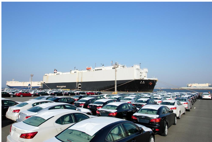
向外国出口的汽车