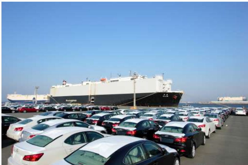
向外国出口的汽车