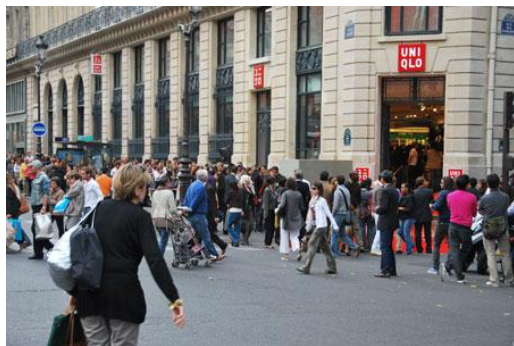
优衣库进军海外（巴黎歌剧院店）

尽管同美国相比，日本的企业在成为跨国公司方面的行动有些迟缓，但其全球化的进程却一刻未曾中断。