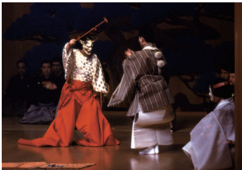
“能剧”表演 图为观世流派演出的《葵之上》中的场景。

能 剧 ( noh ) 和狂言 ( kyogen ) 是日本四大古典戏剧中的两种戏剧形式，另外两种是“歌舞伎” ( kabuki ) 和“文乐” ( bunraku )。“能剧”从广义上说包括滑稽剧“狂言”。公元14世纪，能剧已经发展成为一种独特的戏剧形式，是世界上现存的最古老的专业剧种。尽管“能剧”和“狂言”有着不可分割的共同发展的历史，但两者在很多方面却截然不同。“能剧”基本上是一种象征形式的戏剧，注重在高雅的美学氛围中的宗教礼仪和联想暗示的表现形式。而“狂言”则主要注重通过诙谐滑稽的表演以引人发笑。