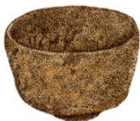
主人用热水在茶碗中将茶搅拌或混合后，再将其递给客人。如果是“浓茶”，客人合用一只茶碗。