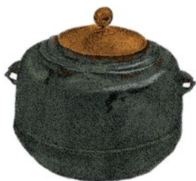
水壶，或“釜” (kama)，用于在炭火上煮水的容器；“釜”的形状变化很多。