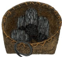
盛放木炭的炭斗，为在火盆或火炉（视季节而定）中生火所用。