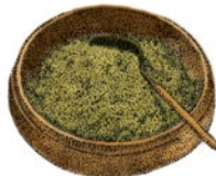
“灰器” (haire) 用于盛放添加到火炉中的湿灰。在燃烧的炭火的边沿周围洒下凉湿的灰有助于使炭火烧得更加旺盛。