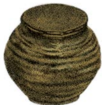
水指 (mizusashi) 或水罐，用于盛放清水，以便为水壶加水。