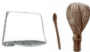
自左至右：擦拭茶碗的亚麻茶巾、取放末茶的茶勺和茶筴。