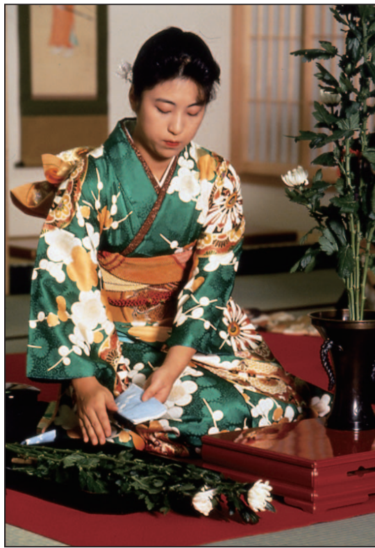
插花 插花可以被视为人们在闲暇之时的一种才艺展示。插花传统上是分等级的，最高级为大师。