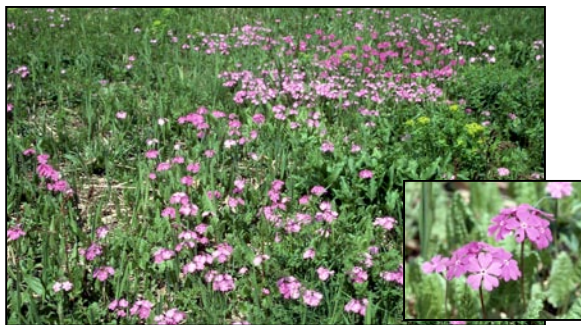
遍野的樱草 ( sakuraso )。

动物在日本文化中扮演着重要的角色。日本人对各种动物所持的多种信仰都来源于中国的古典文学。在史前和远古时