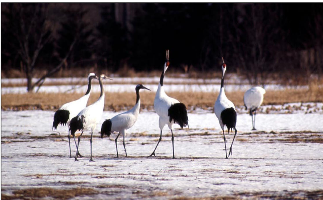
钏路湿地（北海道县）的日本鹤。 这种稀有的鹤在日本属于保护类动物，仅在西伯利亚和北海道繁殖生长。