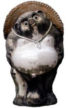
身背草帽、手持酒壶的陶瓷狸猫常常被人们放置在饮酒场所的门外，已经成为一种习俗。

们。据说它们有时还会寄附在人的身体上，使他们发疯。人们至今仍然相信农神稻荷，并在全国各地的稻荷神庙中对狐狸顶礼膜拜。佛教的教义影响着人们对待动物的态度。例如，直到19世纪晚期，几乎没有日本人宰杀四肢动物，而以鱼类作为摄取动物蛋白质的主要来源。在古代中国的历法体系中便有了六十年一个轮回的说法，12生肖（鼠、牛、虎、兔、龙、蛇、马、羊、猴、鸡、狗和猪）中的每种动物均代表12年的一个小轮回。2005年是“鸡年”，第二年便是“狗年”。即使是在今天的日本，每个人依然会将自己的出生年份与某种特定的动物联系在一起。如果有人说，“我出生在‘马年’。”，人们便会认为他（或她）的性格和命运将会受到生肖动物“马”的影响。